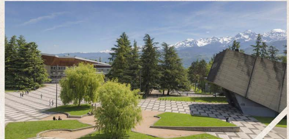
L'université à Saint-Martin-d'Hères et ses pôles d'excellence au coeur des Alpes.