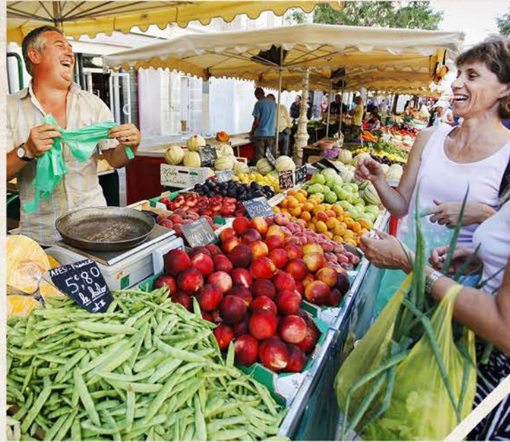
Marchés, petits commerces accessibles à pied, zone commerciale à 750m.