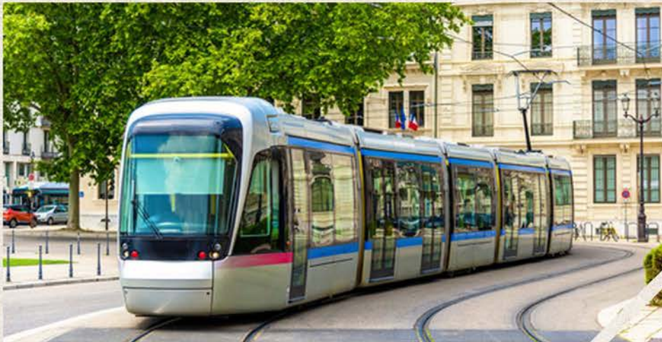
4 lignes de Tram (A, B, C, D et E) desservent Grenoble et Saint-Martin-d'Hères

UN EMPLACEMENT IDÉAL POUR UN QUOTIDIEN FACILE, PROCHE DE TOUTES LES COMMODITÉS ET DU CENTRE DE GRENOBLE !