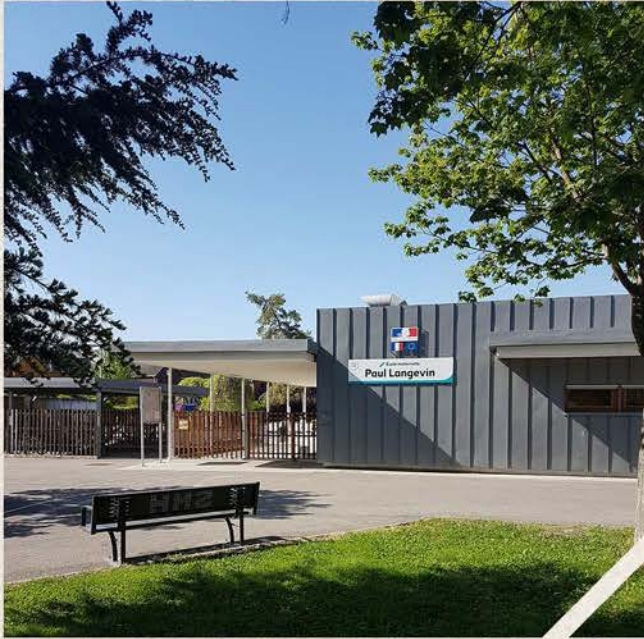
Tout le cursus scolaire de la maternelle à l'université à 2 pas de chez vous.