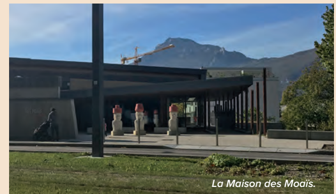
La Maison des Moais.