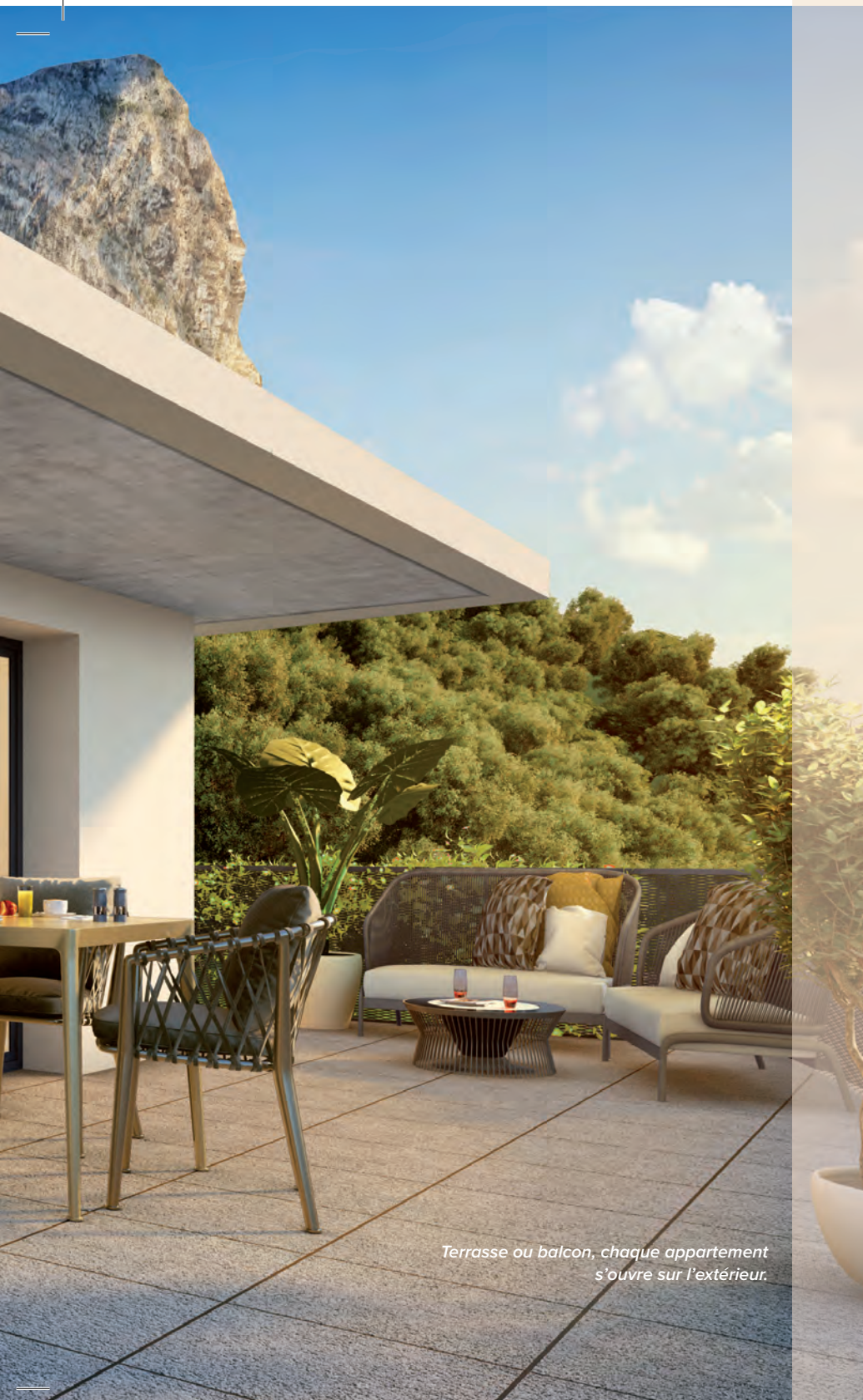
Terrasse ou balcon, chaque appartement s'ouvre sur l'extérieur.