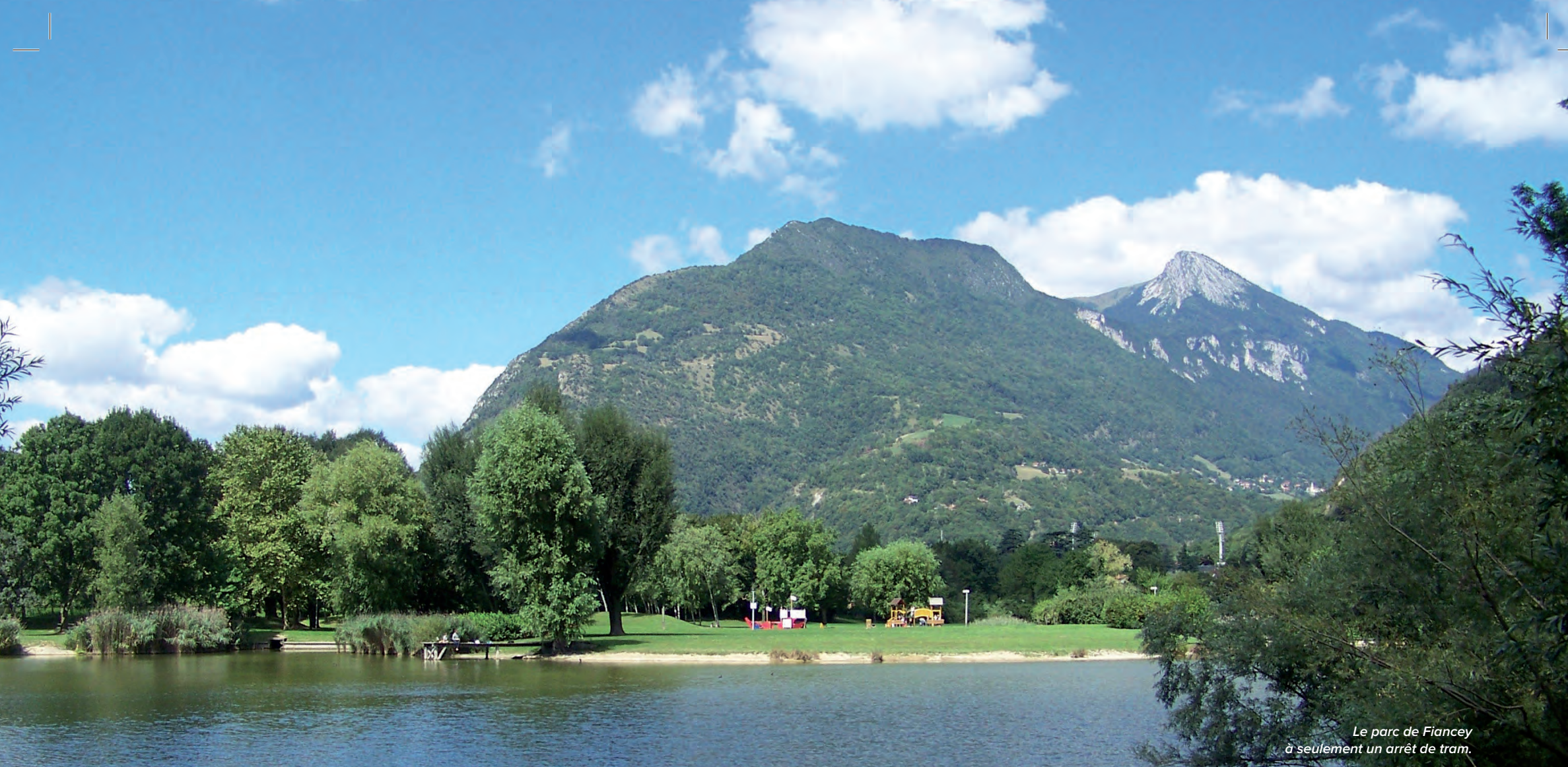
Le parc de Fiancéy à seulement un arrêt de tram.