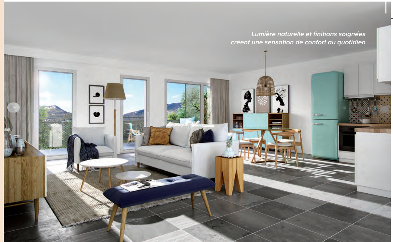
Lumière naturelle et finitions soignées créent une sensation de confort au quotidien