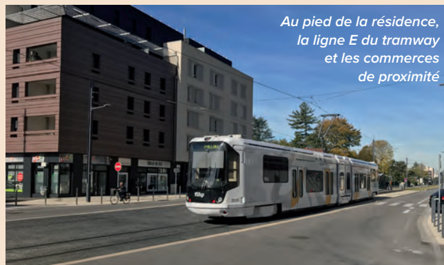
Au pied de la résidence, la ligne E du tramway et les commerces de proximité