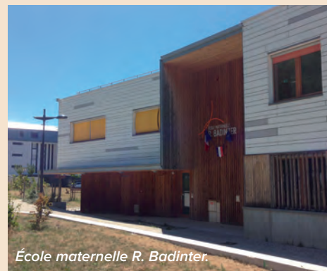
École maternelle R. Badinter.