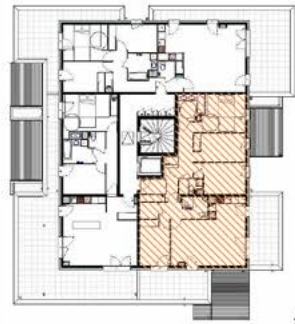
Plan de localisation - NIVEAU R+3